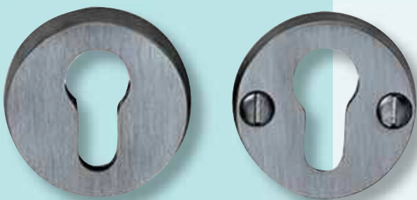
V 409 E ø 50 mm